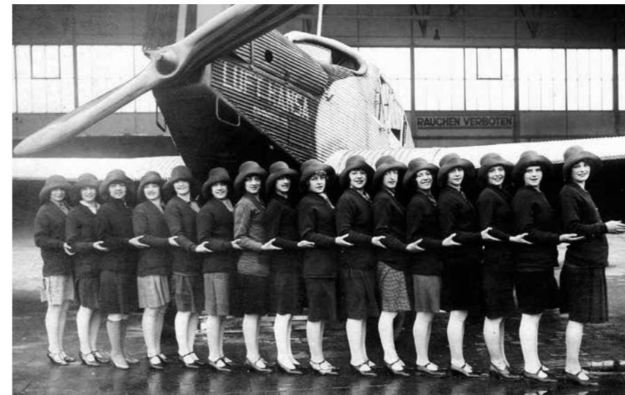
Erinnerungen an vergangene Zeiten: Flugbegleiterinnen im Jahr 1928, eine Aufnahme aus der Zeit als „Messe-Flughafen“ sowie ein Foto des Hangars der Lufthansa in den 1930er-Jahren.