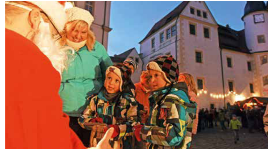
Die traditionelle Colditzer Schlossweihnacht ist für Groß und Klein ein Erlebnis.

cken: Im sparsam beleuchteten, mit Kerzenschein illuminierten Gemäuer begegnen den Gästen Gestalten aus der früheren Burggeschichte, die an diesen Tagen wieder lebendig werden.