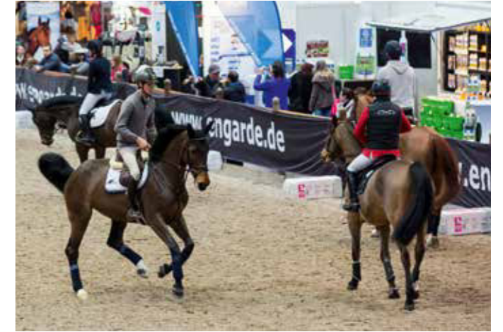
Vier Tage rund ums Ross: die Messe „Partner Pferd“ vereint Show, Expo und Sport.

aus den neuen Bundesländern fest in der stärksten Liga der Welt etabliert.