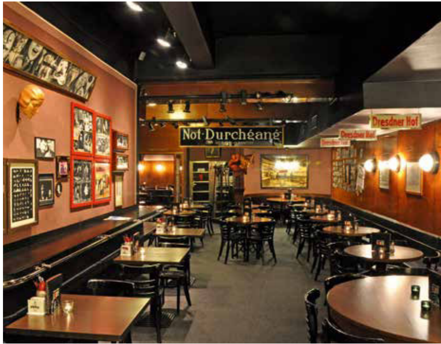
» Typisch in Leipzig: Alle Kleinkunstbühnen bieten während der Show, wie hier im academixer-Keller, auch einen gastronomischen Service an.