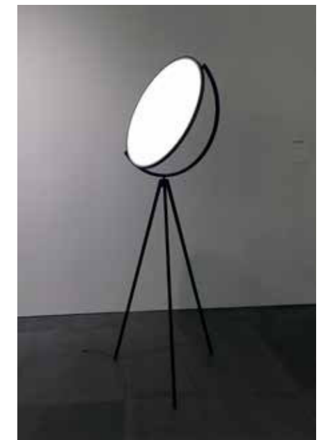
» Außergewöhnliche Lampe: Die Superloon als Urbild des Mondes.