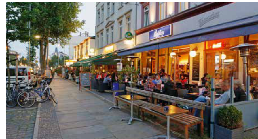
Die Restaurants und Bars auf der „Karli“ sind ein allseits beliebter Treffpunkt für entspannte Abende mit Freunden.