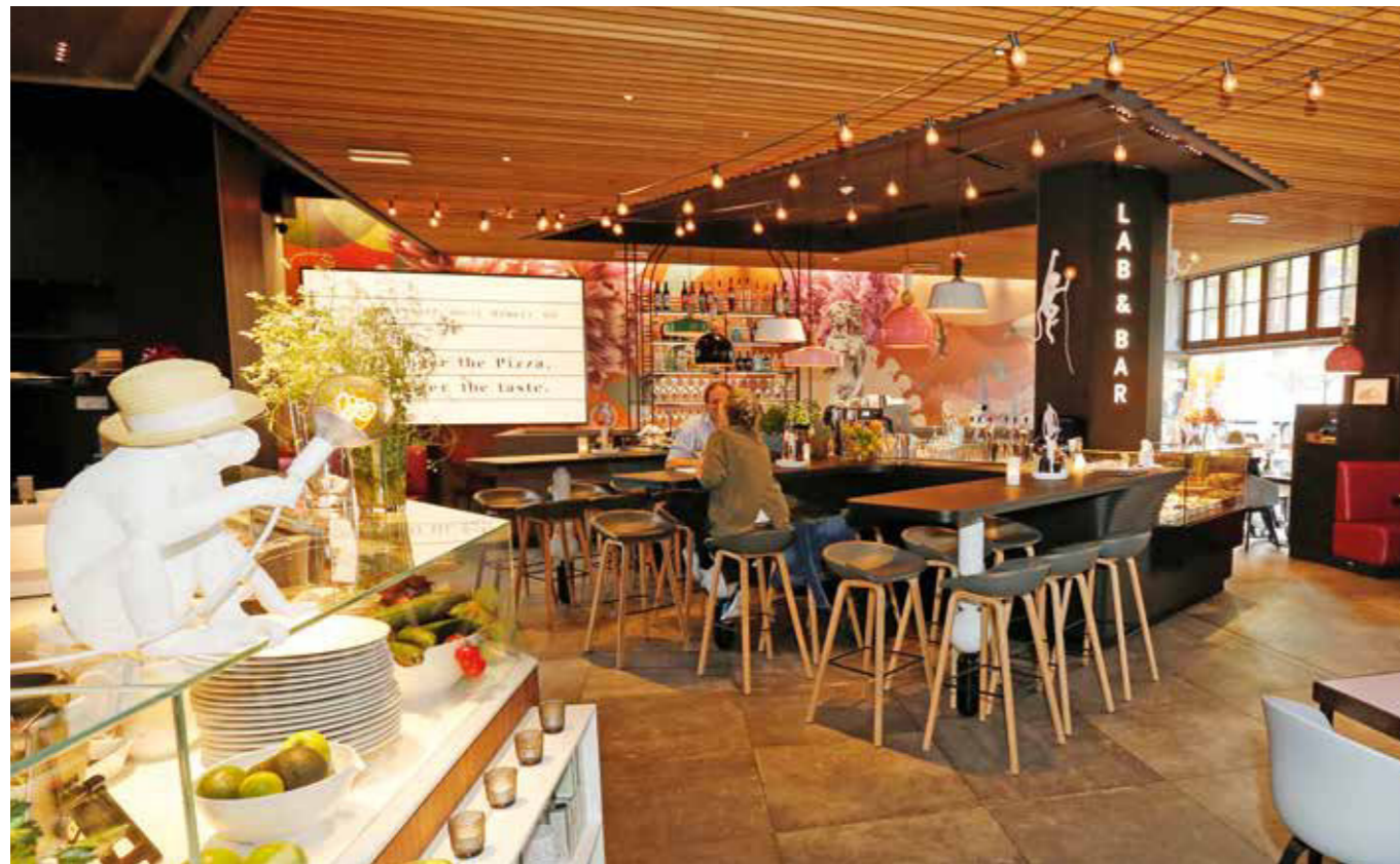
Mit Pizza der etwas anderen Art kommt das White Monkey bei Gästen gut an.

In den letzten Jahren hat Leipzig eine enorme gastronomische Entwicklung hingelegt. Etwa 1.500 Bars, Cafés und Restaurants öffnen fast täglich ihre Türen. Immer wieder kommen ein paar Newcomer hinzu, die frische Impulse setzen und die lokale Gastronomie ergänzen. Hier ein kleiner Auszug aus der vielfältigen Gastro-Szene.