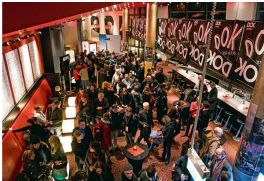
Wenn das DOK Leipzig startet, gibt es vielerorts volle Kinosäle und anregende Gespräche. Es ist das zweitgrößte europäische Festival für künstlerischen Dokumentarfilm.

rige Sonderprogramm steht unter dem Motto „Nach der Angst“ und ist ebenso Anknüpfungspunkt für die bewegte 60-jährige Historie des DOK Leipzig. „Mit Bezug auf die Festivalgeschichte und im Hinblick auf die Zukunft wollen wir mit unserem Programm Werte hochhalten, welche die Festivalgründer zu verteidigen suchten: Meinungsfreiheit, Kunstfreiheit und Menschenwürde. Gleichzeitig lehrt die Festivalgeschichte, dass nach der Angst auch vor der Angst sein kann [...]. Wir müssen stetig für demokratische Werte kämpfen“, erklärt Festivaldirektorin Leena Pasanen. Cineasten kommen auf ihre