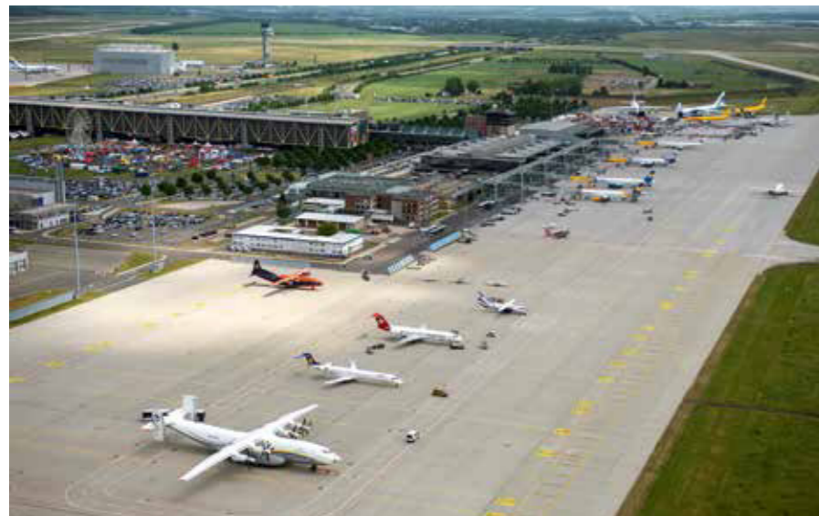
Flughafen Leipzig/Halle: Beliebter Startpunkt für Urlauber und wichtiges Drehkreuz für den internationalen Frachtverkehr.

Die Planungen für den Bau begannen im Jahr 1925, im Mai des Folgejahres wurde die Errichtung schließlich offiziell beantragt. Der erste Spatenstich für den zentral gelegenen Flughafen folgte am 1. September