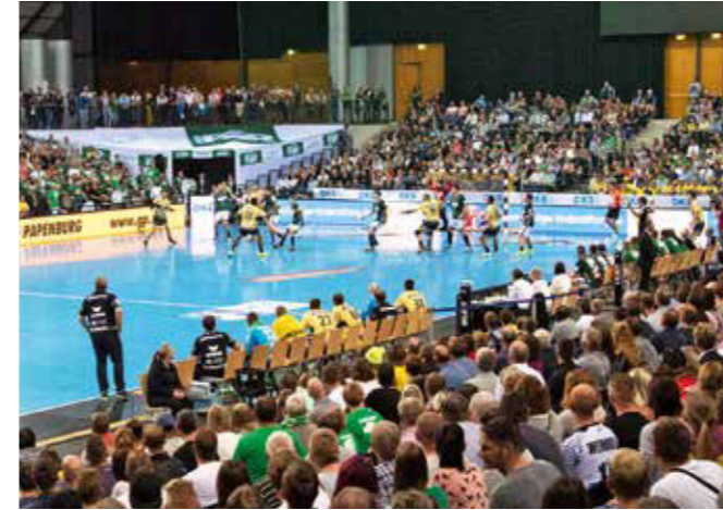
Begeistern bei den Heimspielen in der Arena: die Handballer des SC DHfK Leipzig.