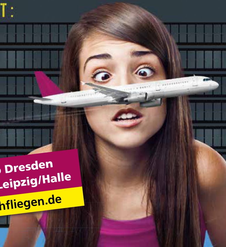
Bildnachweise: Testimonial: © Asier Romero/Shutterstock | Flugzeug: © ER_09/Shutterstock

Ab Dresden und Leipzig/Halle nahfliegen.de