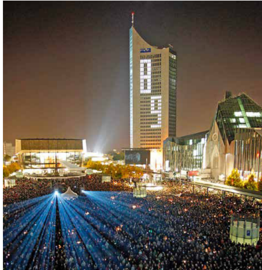
» Ein Ort der Zusammenkunft: Jährlich nehmen Tausende am Lichtfest teil und denken gemeinsam an die Friedliche Revolution zurück.

Tausende Leipziger und Gäste kommen alljährlich am 9. Oktober beim Lichtfest Leipzig auf dem Augustusplatz zusammen, um gemeinsam an die bahnbrechenden Ereignisse im Herbst 1989 zu erinnern.