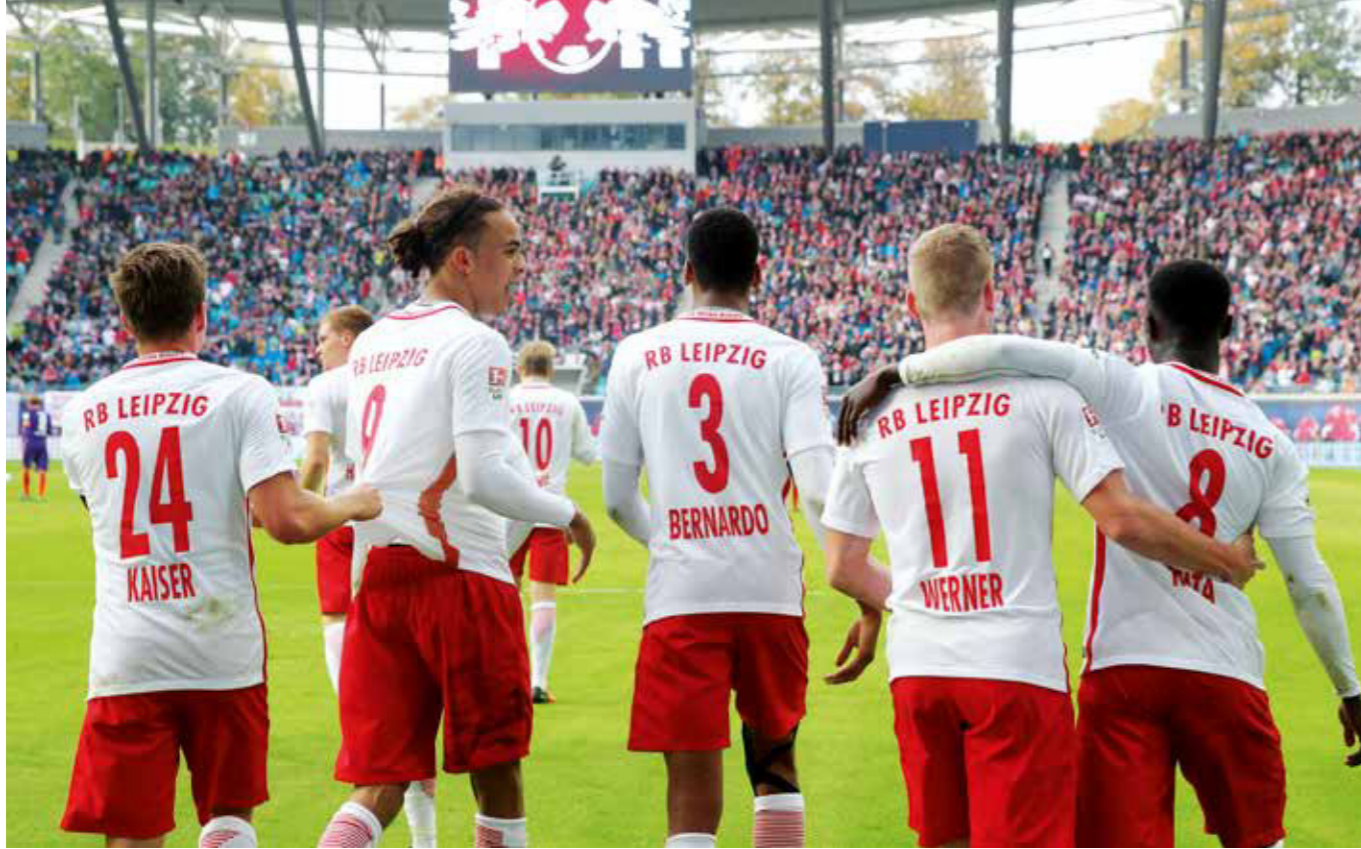
Auf Erfolgskurs: Die Fußballer des RB Leipzigs haben sich mit einer hervorragenden Saison in die Champions League gespielt.