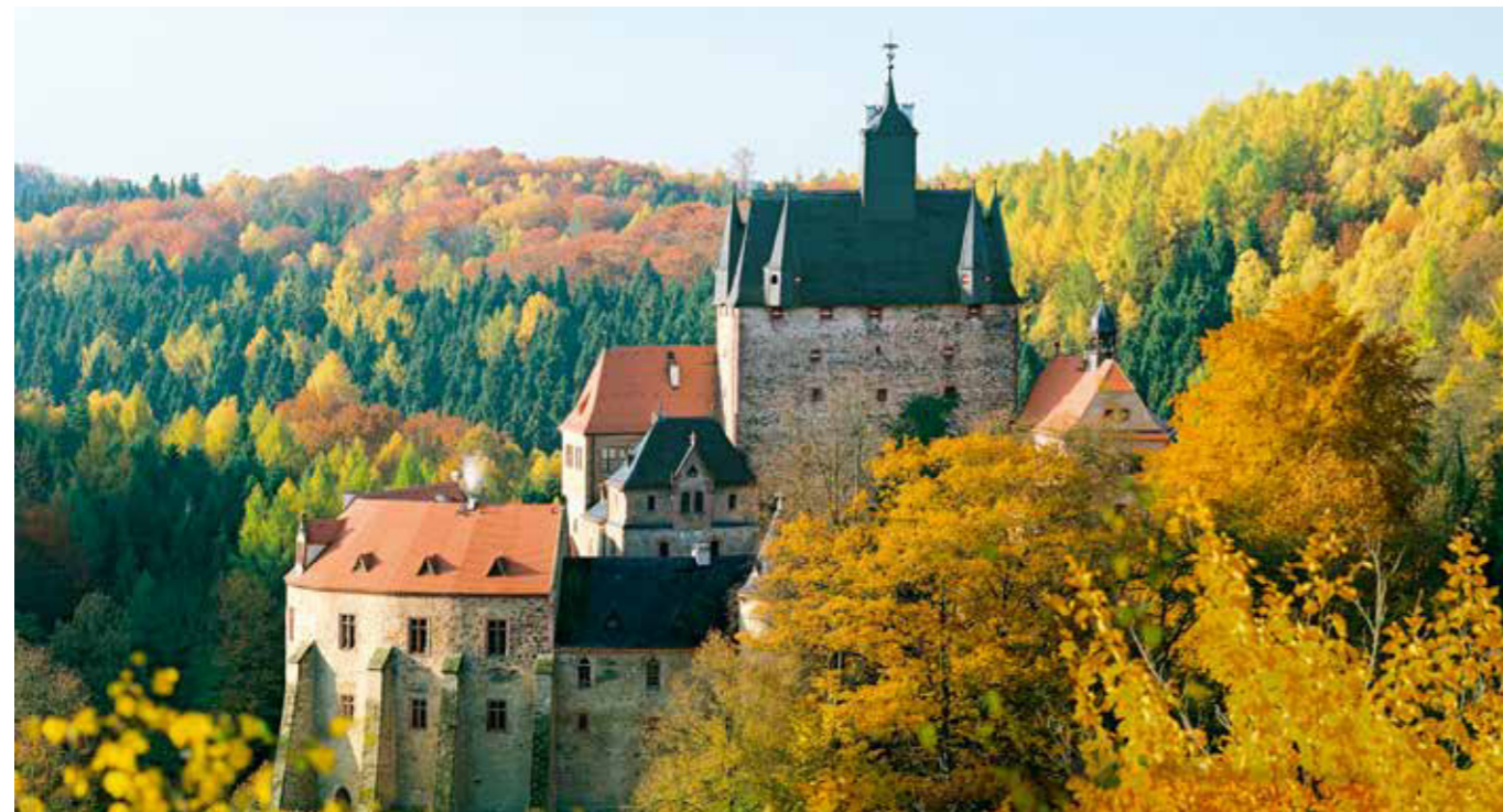
Die Burg Kriebstein gilt als Sachsens schönste Ritterburg. In dem alten Gemäuer erwachen sogar ehemalige Bewohner des Wohnturms für die „Geheimnisvollen Führungen“.

Wer es noch informativer mag, dem seien die „Geheimnisvollen Führungen“ im November und Dezember angeraten. In der circa einstündigen Führung erfahren Interessierte allerlei Wissenswertes zur Burg und zu den früheren Lebensumständen. Bei dem Rundgang selbst gibt es viel zu entde-