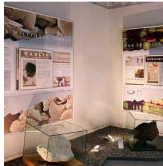
Ein Blick ins Geschichtsbuch unserer Erde: die Ausstellung im Herrenhaus Röcknitz.

So informiert das Herrenhaus Röcknitz in seiner Ausstellung über die gewaltigen Kräfte, die unsere Erde bis heute formen, und vermittelt im angrenzenden Geoerlebnisgarten mit Vulkanspielplatz spielerisch ihr Zusammenwirken. Im Steinarbeiterhaus Hohburg spüren Besucher den authentischen Lebens- und Arbeitsbedingungen