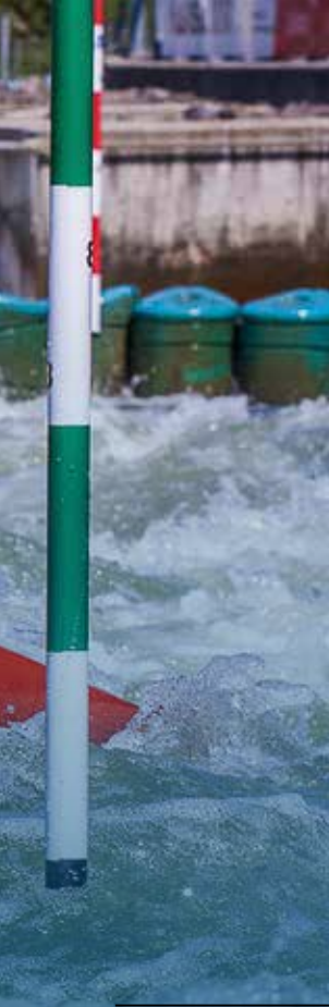
Schweiß, Tränen, Triumphe: Leipzigs Sportkalender lässt auch im Sommer Großes erwarten.

zur Sache, vom Publikum am Streckenrand frenetisch beklatscht.