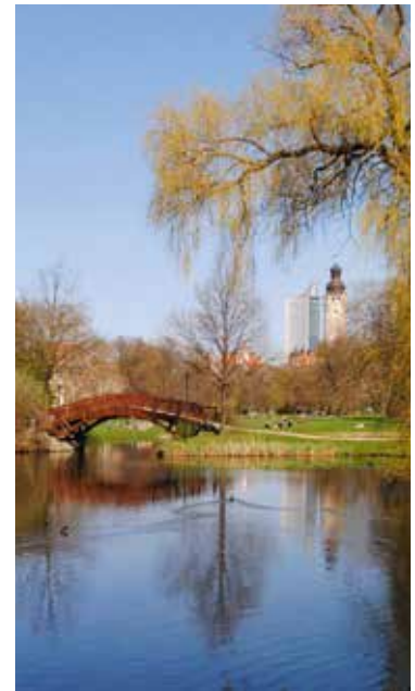
Innerstädtische Idylle: Der Johannapark verbindet Promenadenring und Clara-Zetkin-Park.

Promenadenring im Lauf der Zeit immer wieder verändert. Deutlichster Beweis ist der Augustusplatz: Von den Rondellen und Bauten des 19. Jahrhunderts ist nur der Mendebrunnen geblieben – mit Oper, Gewandhaus, Paulinum und City-Hochhaus prägen stattdessen Prunkbauten aus DDR- und Nachwendzeit das heutige Gesicht des Platzes und machen ihn zu einem historisch wie architektonisch spannenden Stück Stadt.