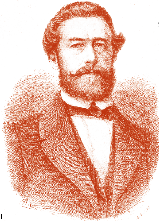
Dr. D. G. M. Schreber.

Von den positiven Effekten des Turnens überzeugt, gründet Schreber 1840 den ersten Leipziger Turnverein. Auch empfiehlt er »systematische Heilgymnastik« zur Ertüchtigung der Stadtjugend. Überhaupt nehmen Gesundheit, Bildung und Erziehung von Kindern und Jugendlichen