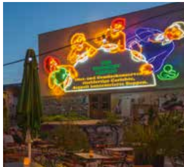
Die »Löffelfamilie«: leuchtendes Wahrzeichen des Feinkost-Geländes

Leipziger Lebensgefühl schnuppern kann man auf dem kleinen, aber bunten Feinkost-Flohmarkt . Dank überdachter Stände lässt es sich hier bei jedem Wetter entspannt trödeln und tratschen, stöbern und staunen.