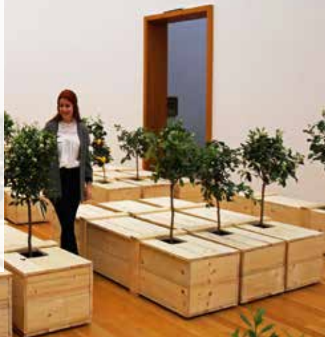
YOKO ONO. EX. IT. 1997/2019. © YOKO ONO.