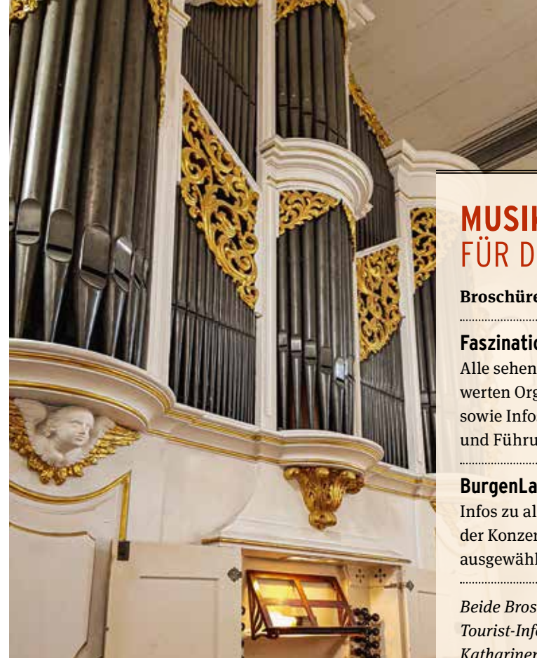
Genuss für Auge und Ohr in Bad Lausick: die Silbermann-Trampeli-Orgel in St. Kilian.