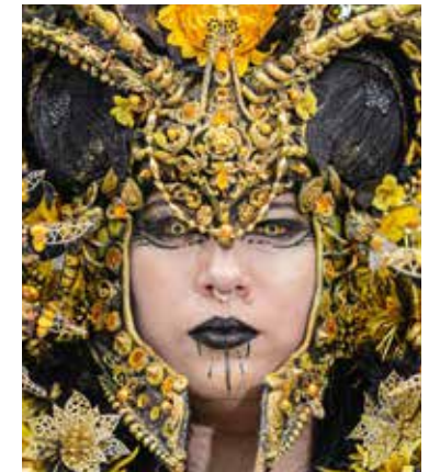
Bücher als Kunstobjekte, wie dieses von Fernand Léger, zeigt das GRASSI Museum für Angewandte Kunst. BILD OBEN