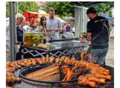
Mekka für Mittelalterfans: das Burgfest auf Burg Kriebstein. BILD OBEN