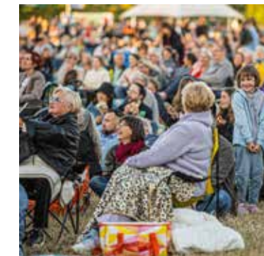
Woodstock? Nee, Rosental – beschallt vom Gewandhausorchester zum Spielzeitabschluss. Motto: »Klassik airleben«!

Und rund um Leipzig? Dort bittet ab Ende April die »Königin der Instrumente« zur Audienz – und das gleich mehrfach. Denn die Region Leipzig verfügt bekanntermaßen über einen bemerkenswerten Reichtum an Orgeln bedeutender Baumeister. Ob Silbermann oder Ladegast, ob Kreuzbach oder Hildebrandt: Sie alle hinterlie-