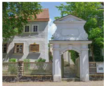
Auch heute noch so idyllisch wie vor 250 Jahren: das Schillerhaus im Stadtteil Gohlis.

licken wir zunächst zurück: Um 1450 erfindet Johannes Gutenberg in Mainz den Buchdruck mit beweglichen Lettern – eine Revolution in der Geschichte des Schreibens und Lesens. Rasch fasst die neue Technologie auch in der – an potentiellen Käufern reichen – Universitätsstadt Leipzig Fuß. Und weil die auch noch an der Kreuzung zweier wichtiger Handelswege liegt, mausert sich die Messestadt ziemlich schnell zum – neben Frankfurt – europaweit wichtigsten Umschlagplatz für die begehrten Druckwaren. Das wiederum lockt Drucker, Verleger und Buchhändler an. Zur Reformation boomt dann das Geschäft mit den Schriften Martin Luthers, und dass die Leipziger Zensur laxer ist als