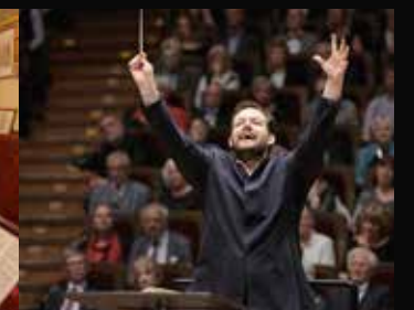
Gewandhauskapellmeister Andris Nelsons