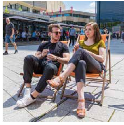
Draußen feiern und genießen

Produkte der hiesigen Höfe und Manufakturen – 13. Mai, 10. Juni 2023 » klosterbuch.de