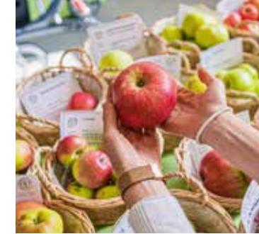
Einfach zum Anbeißen: Obst und Co. aus regionalem Anbau. Gibt's zum Beispiel beim Bauernmarkt im Kloster Buch!

Für die Stadt war der kirchliche Feiertag seit jeher auch ein Messttag. Eine Tradition, die der Ostermarkt und die Historische Leipziger Ostermesse aufs Schönste wiederaufleben lassen: Vom 5. bis 10. April locken in der City zahlreiche Stände, die allerlei österliche Erzeugnisse feilbieten – Süß- und Backwaren, Pflanzen und Hausbedarf, Köstliches von Kaffee bis Wein sowie Kunstgewerbe von Schmuck bis Keramik. Passend zum Renaissance-Ambiente des Marktplatzes buhlen vor dem Alten Rathaus zudem Jongleure, Musikanten und Komödianten um Aufmerksamkeit – stilecht gewandert wie vor 500 Jahren. Und für Speis und Trank sorgen Tavernen und Garküchen.