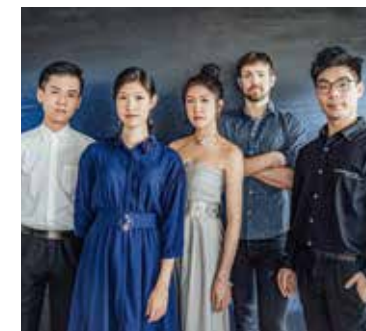
Erstmals zu Gast beim a-cappella- Festival: »Voco Novo« aus Taiwan.

Multinational wird es mit den Alte-Musik-Spezialisten L'ultima parola und den Vocal Jazzern von Accent , zum Eröffnungskonzert begrüßen die Leipziger Gastgeber amarcord die Österreichischen Salonisten , und ein lang erhofftes Wiedersehen gibt es mit der deutschen A-cappella-Comedy-Kultgruppe U-Bahn Kontrollöre in tiefgefrorenen Frauenkleidern . Nicht fehlen darf natürlich auch der Internationale a-cappella-Wettbewerb , und für ein ganz besonderes optisch-akustisches Bonbon sorgt das britische Orlando Consort : mit Live-