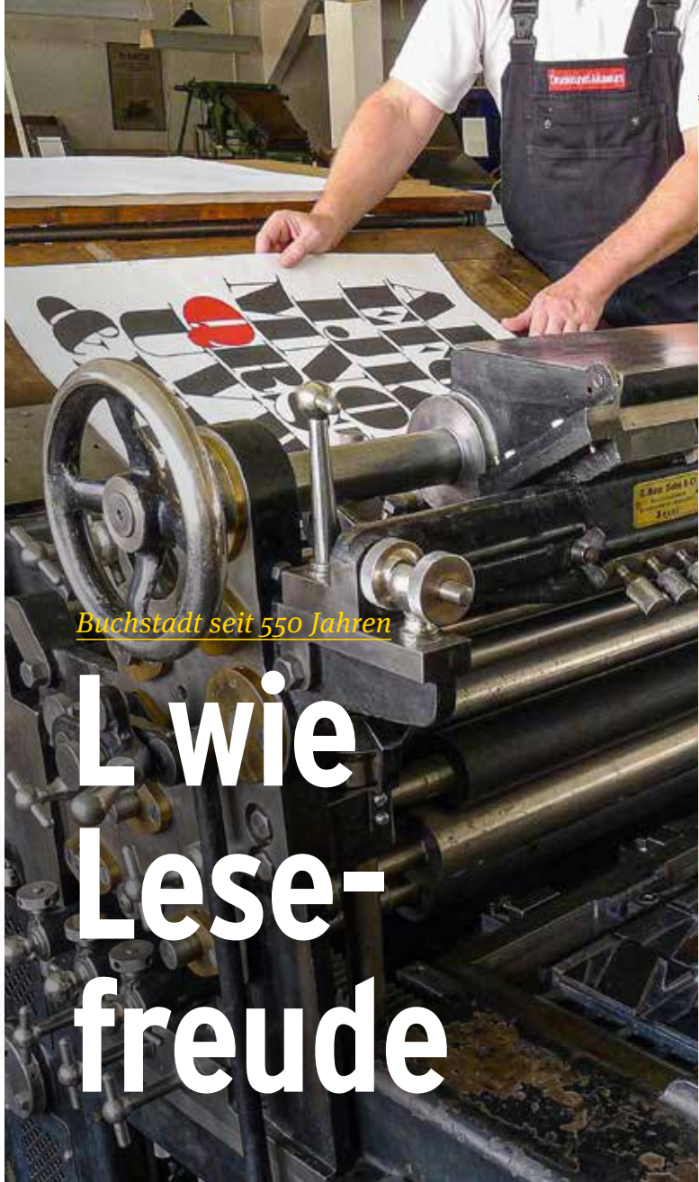
Buchstadt seit 550 Jahren

Im 19. Jahrhundert siedeln sich weitere wichtige Verlage wie Brockhaus, Baedeker und Reclam in Leipzig an. 1825 wird der Börsenverein der deutschen Buchhändler zu Leipzig gegründet. Und die Zahl der Verlage, Buchhandlungen, Druckereien, Buchbindereien, Schriftgießereien und lithografischen Anstalten wächst immer weiter, die meisten lassen sich im »Grafischen Viertel« in der heutigen Oststadt nieder. Auch die Buchkunst blüht im 19. Jahrhundert in Leipzig auf, gepflegt unter anderem an der hiesigen Kunstakademie.