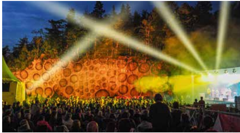
Da lohnt schon der Ort den Eintritt: Burg Mildenstein bei Leisnig (BurgenLandKlänge). BILD LINKS