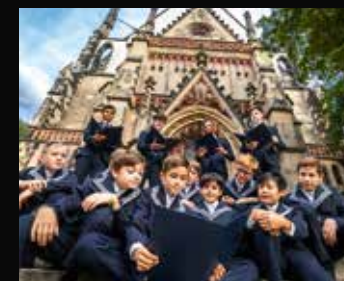
Thomanerchor Leipzig